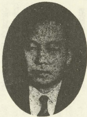
東 栄 町 長