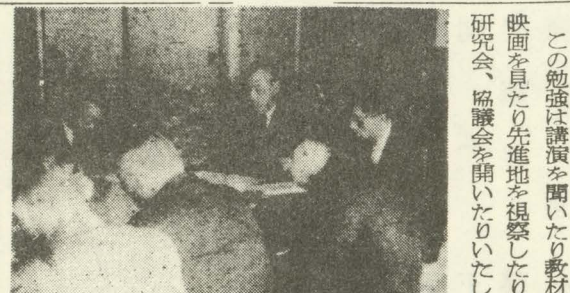
公民館振興現地懇談会

婦人会活動、青年団活動、婦人層が中心となつてゐる社会学級、青年団が中心となつてゐる青年学級等その形体とか方法等も色々ありますがこれ等は皆、家庭にあつては立派な親であり、兄であり姉であると同時に社会にあつてはよき社会人であり、子供達に対して立派な先輩であり指導者であるための勉強であると思つておきます。