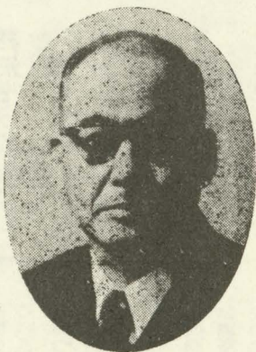
東 栄 町 議 会 議 長

識すると同時に、日進月歩の世に処して今日の我身を進歩なく明日に持越してはならないと切実に考