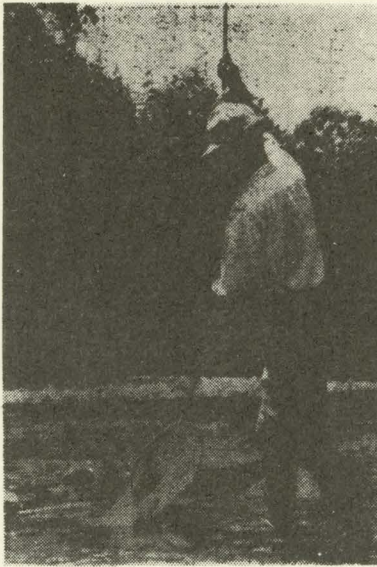
銀鱗は招く (振草川の友釣)