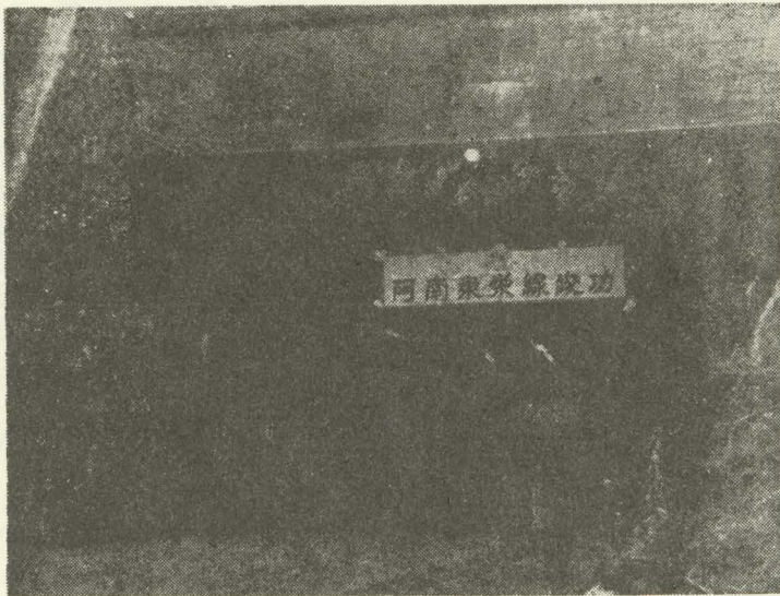
県道阿南東栄線御園隧道東栄町側入口

一、自主の精神をかん養し勤儉貯蓄により経済力を強固にする。 一、道路網の拡充を図り産業の振興教育文化の向上を期する。 一、伊勢湾台風災害復興の早期実現を期し民生の安定をはかる。