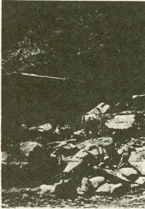
台風24号による住家の倒壊 (足込地内)