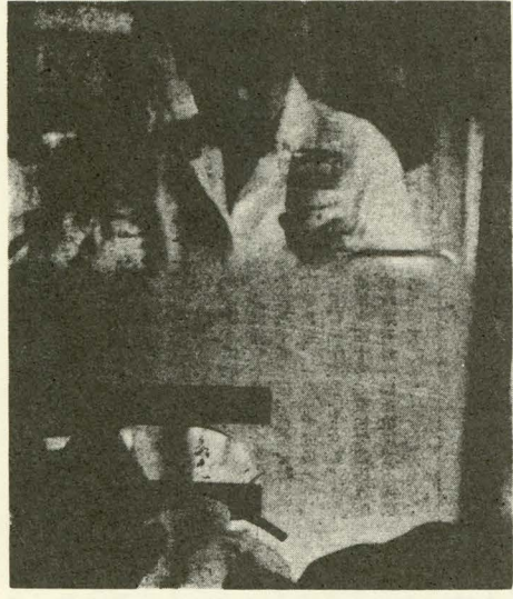
(日赤献血車内での献血風景)

あなたのため、みんなのため に献血ををモットーに、「愛の血助け合い運動」がいまや全国的に展開されています。この