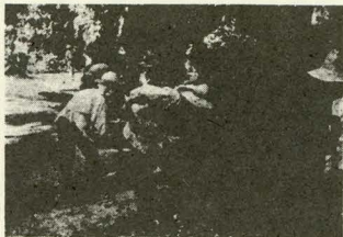
心あわせての奉仕作業

九月の下旬から十月の中旬にかけて、毎年計画している道路愛護奉仕作業を実施しました。愛護奉仕作業を実施し、町内の道は見ええるように美しくなりました。