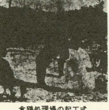
食鶏処理場の起工式