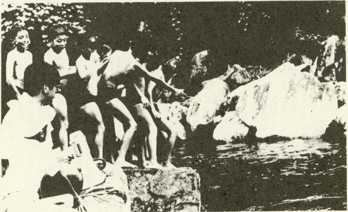
あ、魚だ 魚とおよぎっこだ！