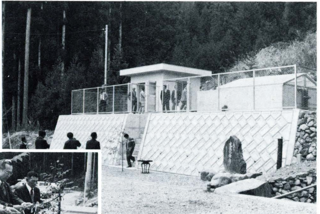
竣工を祝って テープカット