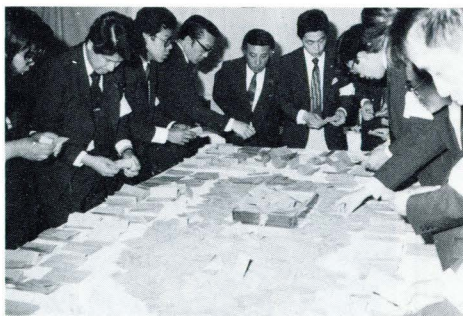
一票一票慎重に開票

開票は緊張したふんい気の中で 役場職員の手により一票一票慎重 にまとめられていく状況に運動員 たちの真剣なまなざしが集中。 また、前後二回に分けて発表さ れた開票速報に場内から一喜一憂 のどよめきが。