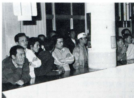
固唾をのむ参観者

開票は緊張したふんい気の中で 役場職員の手により一票一票慎重 にまとめられていく状況に運動員 たちの真剣なまなざしが集中。 また、前後二回に分けて発表さ れた開票速報に場内から一喜一憂 のどよめきが。