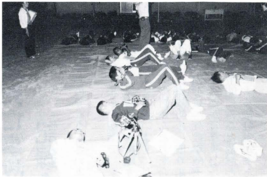
（コンテストに 参加中の様子）

環境庁主催のスターウォッチングコンテストの結果が、十二月九日に発表され、東栄町は、「星空の街」として選定されました。 このコンテストは、夏の代表的な星座「こと座」の中のベガ（おりひめ星）、エプシロン星、ゼータ星に囲まれた三角形の部分に見える星の数を競うもので、東栄町をはじめ、全国で二百六十七市町村、九千八百十四人が参加し、百八市町村が選定されました。 東栄町では、役場民生課が中心となつて八月十六日から八月二十四日まで、東栄中学・本郷高校の生徒二十三名の参加のもとに、御園小学校庭で観察をしました。この期間は、天候が特に不安定でこまりましたが、六日間にわたり双眼鏡で観察しました。この結果、