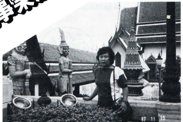
（エメラルド寺院にて）

この事業は、諸外国の婦人の現状を視察・交流することにより相互理解を深めようとするもので、県内より、十人が派遣されました。タイ厚生大臣、タイ内務省婦人労働局、福祉協会などを訪問するとともに、バンコク、アユタヤ、スコタイ、ピサヌロークなどの都市を回りました。 タイでは、日本に対する関心が高く、たいへん歓迎されました。