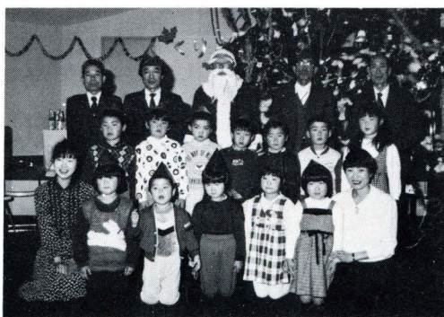
▶サンタと記念撮影

四保育園のひとつ、御殿保育園の子供たち四十二名は、ライオンズサンタが会場に登場すると、子供たちから歓声が起り、クリスマスは最高潮、さっそくサンタクロースからプレゼントをもらって嬉しそう、サンタクロースとゲームをしたり、記念撮影をしたりして楽しいひと時を過ごしました。