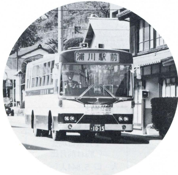
3月末で姿を消す、豊鉄バス(浦川線)