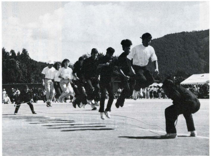
▲チームワークが勝負の決め手の縄跳び

表紙でもご紹介しましたが、東栄町体育協会主催、中日新聞本社後援による「町民体育大会」が、好天に恵まれた十月十日に東栄中学校グラウンドで行われ、町民の皆さんが競技に応援にと、体育の日の一日を楽しみました。 体育大会の呼びものの地区対抗競技は、中学男女のリレーから始まり、年齢別の男女六百メートルリレーを最後に全種目を終了。各選手とも日頃の練習の成果を力一杯発揮しました。この結果、本郷地区が各種目とも好得点を重ねて三回連続の総合優勝を飾りました。二位以下の成績は次のとおりです。 二位 振草、三位 下川、四位 園、五位 御殿、六位 三輪。