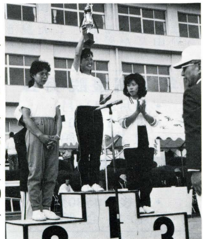
▶喜びの表彰台(年齢別女子600R)