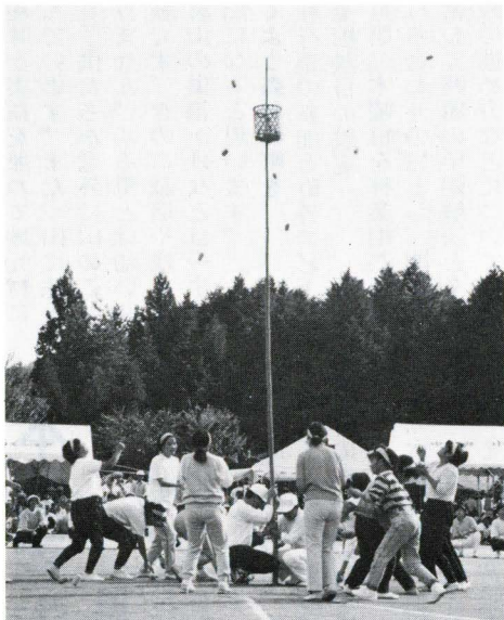
◀狙いを定めてソレツ!