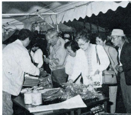
特産品コーナーも盛況