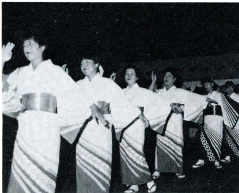
婦人会の「設楽さんさ」

て盛り上がりを見せました。 また、会場内では特産品や酒、アユの塩焼き、そば、五平餅などを販売するテントが並び、大勢の人達でにぎわいました。