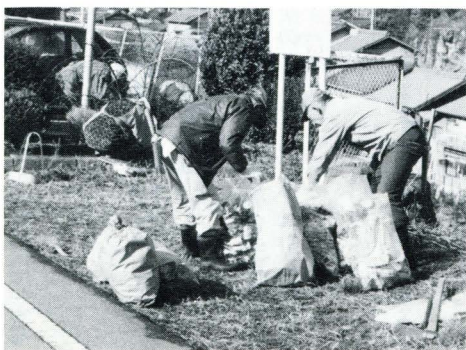
▲ 駅周辺に捨てられていたあきかんなどを回収