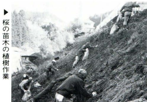
▶ 桜の苗木の植樹作業