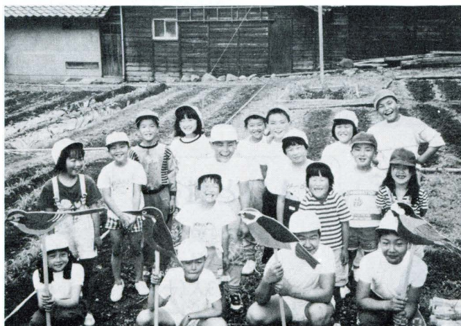
全校児童が4つのだて割班で活動 (粟代小)