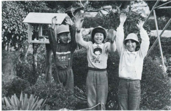
工夫して作った給餌台が完成 (月小)

全校で取り組む愛鳥活動「野鳥とすごす学校生活」をテーマに発表した月小学校は、全校児童十二人。四、五、六年生の四人が活動状況などをスライドや図表などを発表しました。活動は児童会が中心となっており、今年度は学校周辺の山林に十一の巣箱をかけて、営巣した野鳥の種類などを調べました。その結果、十一の巣箱のうち、四つの巣箱にシジュウカラとヤマガラが営巣して、元気に巣立ちました。