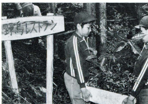
「粟代っ子の森」に完成した野鳥レストラン