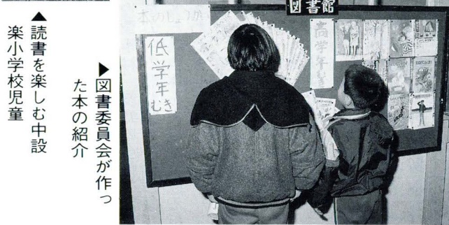
▲読書を楽しむ中設楽小学校児童