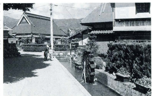
明るいまちづくりが進められている雨森区

まちづくり委員会では、今後の活動の参考にしようと、一月二十五日(金)、まちづくりの先進地である滋賀県高月町雨森区への視察を行いました。