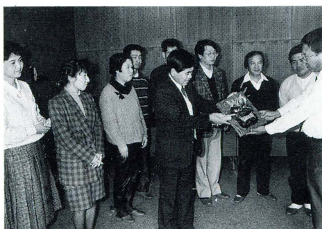
記念品を贈る西尾会長