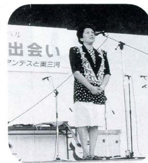
州知事メッセージ

また、輪の中には来場者も入り一緒になって踊りました。これらが終了する頃になると陽も落ち、会場もにぎやかなくなってきました。 会場内には、メインステージの他、交流ゾーンのスペースには、東栄町の味の紹介や中南米の民芸品の即売といったコーナーや各種のバザーが設けられ、来場のみなさんの目をひいていました。 ステージの方では、今回このフェスティバルのために東栄町に招かれた「ファミリア・ロドリゲス」のコンサートの準備が進められました。 このグループは、ペルーを代表するフォルクローレ（民族音楽）演奏グループで、家