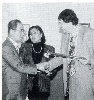
ニューウェストミンスター中学校長と東栄中百々校長、友好の握手

異文化理解、英語学習への意欲化そしてお世話になった方々への感謝の心など、この研修は生徒を大きく変容させ、成長させてくれるものと期待しています。このような機会を与えてくださいました町ご当局、町議会、町民の皆様、保護者の方々に感謝を申し上げます。