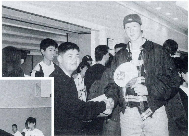
上：ニューウェストミンスター中学校にて ヘアの生徒との出会い

花祭りは東栄町の代表的な伝統芸能です。花祭りが大好きな僕は、東栄のこの花祭りをぜひカナダの人たちに紹介したいと思っていました。念願かなって、ニューウェストミンスター中学校との交流会で花祭りの笛と舞を発表することができました。榊鬼を舞うときには、足ががくがくしました。しかし、東栄町の代表なんだと思って、一生懸命やりました。舞い終わったとき、大きな拍手をしていただきました。胸が熱くなりました。 カナダの人に東栄町の文化を伝えたいことに満足しています。自分にも自信がつけたいし、よい思い出になりました。