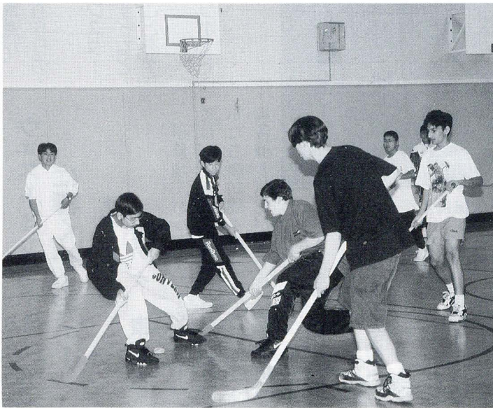
左：スポーツ交流会、楽しいホッケー