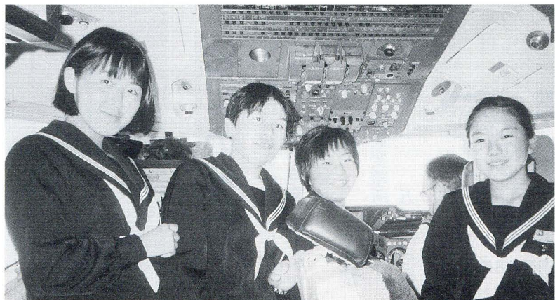
カナディアン航空のコックピットにて

をとっていただいたり、機長のワーカーさんにサインをしてもらったりもしました。コックピットはたいへん狭いところです。初めて見た人はみんな驚いていました。