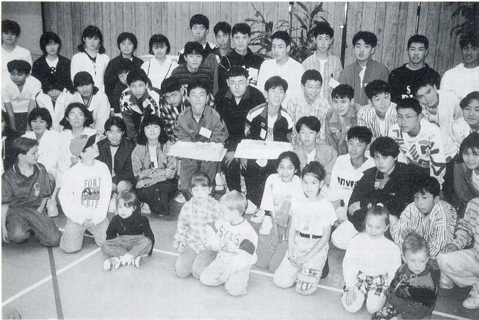
コキットラムの教会にて ホストファミリーの子どもたちと

ホームステイでは、私たちの不十分な英語でも最後まで聞いてくれ、日本のことや東栄町のことをたくさん知ってもらうことができました。これからも、英語を一生懸命勉強し、いつかもう一度カナダへ行きたいと思います。そして、英語でコミ