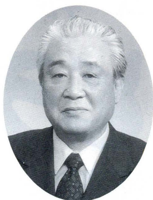
東 栄 町 長