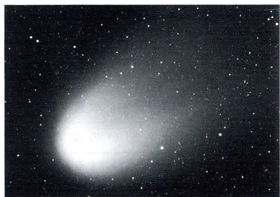
2月12日 反射望遠鏡で撮影

ヘール・ポップすい星が再び地球に近づくのは2540年後になります。この歴史的な天文ショーをぜひご覧ください。