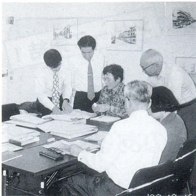
編集委員による調査

今後町内に残るものの確認に努め、密度の濃い史料収集を目指しています。皆さんのお宅にひっそりと眠っている古文書類がございましたら、ぜひ町誌編さん事務局（☎六一二六五）までお知らせください。