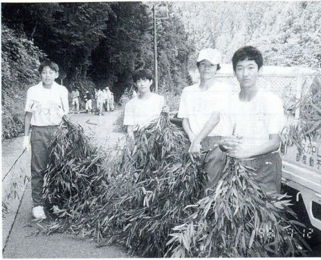
蚊に刺されながらの竹取り

10月16日、東栄中学校の生徒会から特別養護老人ホームやまゆり荘に、手作りの竹ぼうき10本が贈られました。 この竹ぼうきは、生徒が自ら計画して実践する「チャレンジ東中」の活動の中で、「チャレンジすること、周りの人を幸せにしよう」との思いから作られたものです。 竹取りはもちろんのこと、竹林の所有者への交渉までも生徒が主体となっていて行い、こうして手に入れた竹を使って530本（ゴミゼロの願いか