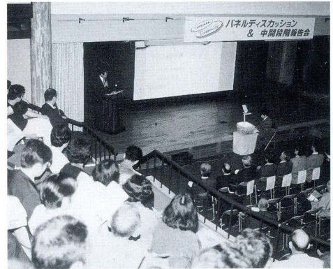
基調報告のようす

町の新たな発展が期待される、三遠南信自動車道の東栄インターチェンジ（仮称）。その周辺整備構想の策定を平成9年度から開始し、住民アンケートやヒヤリング調査など、様々な方法で多様な情報を収集してきました。 こうした調査は、この構想を「地域に根ざした構想」にするためのもので、住民の皆さんに内容を理解していただき、さらに多くの意見を取り入れたものを目指しています。 そこで、この調査のパネルディスカッション&中間段階報告会を10月21日に開催し、町内外からおよそ300人の方が訪れました。 はじめにワーキングメンバー（役場職員から選抜された7名）が、これまで行った調査の進行状況を発表。