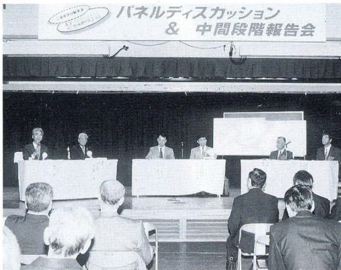
パネルディスカッションのひとこま

町の新たな発展が期待される、三遠南信自動車道の東栄インターチェンジ（仮称）。その周辺整備構想の策定を平成9年度から開始し、住民アンケートやヒヤリング調査など、様々な方法で多様な情報を収集してきました。 こうした調査は、この構想を「地域に根ざした構想」にするためのもので、住民の皆さんに内容を理解していただき、さらに多くの意見を取り入れたものを目指しています。 そこで、この調査のパネルディスカッション&中間段階報告会を10月21日に開催し、町内外からおよそ300人の方が訪れました。 はじめにワーキングメンバー（役場職員から選抜された7名）が、これまで行った調査の進行状況を発表。