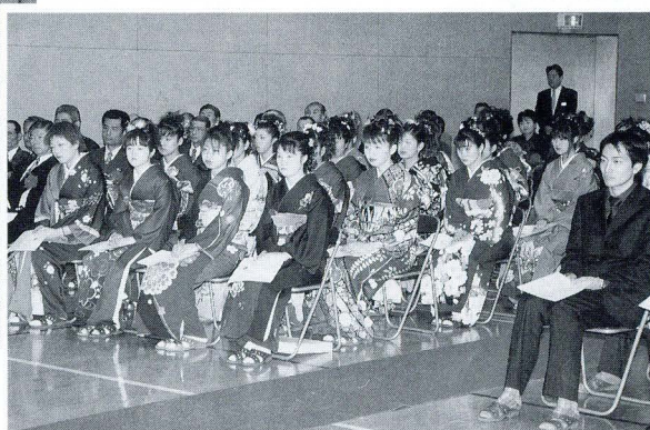
演奏に酔いしれたひと時 曲目は「空」と「津軽じょんがら節」