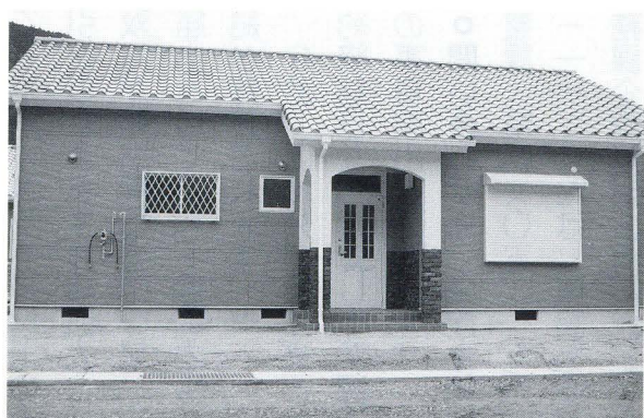
和室を好む方のために 2間続きの部屋と床の間を設置