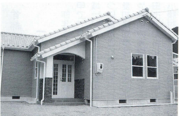
キッチン・ダイニング・居間と 連続性を持たせた広々空間