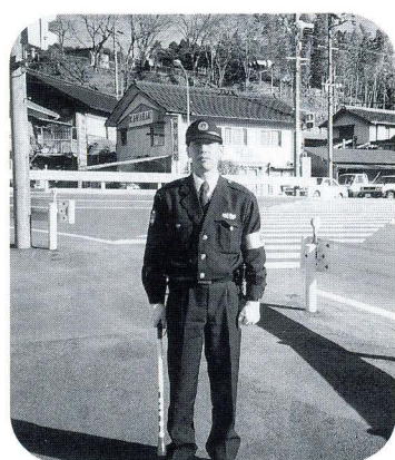
中設楽交差点にて

昨年3月末に、中設楽交差点が新設されました。心配された交通事故も、今までのところ大事に至るものは発生していません。これからも安全運転をお願いします。また、この季節は道路の凍結が心配されます。十分に注意してください。