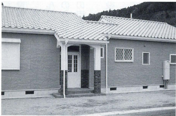
中庭テラスを設け 軽食・野外料理などが可能