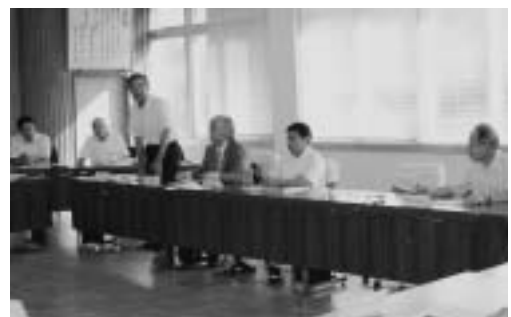
健康づくり大学推進協議会

平成19年度に健康づくり大学東栄キャンパス事業基本計画が策定され、事業主体として産学官連携による「東栄町健康づくり大学推進協議会」を設立し、三遠南信地域連携センター長も協議会のメンバーとして平成20年度・21年度も加わっていたいでいます。 また、平成21年6月に開催された健康づくり大学では、愛知大学の落語研究会の学生に協力いただき、落語鑑賞を行いました。