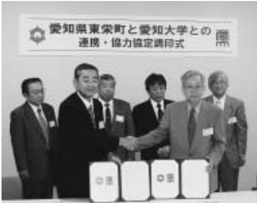
平成 19 年 6 月 22 日調印式の様子

東栄町と愛知大学（豊橋市）は、平成19年6月22日、地域づくりに関して、連携と協力をしていくための調印をしました。 それより両者が連携して、教育（生涯学習）や産業振興などについて人材や資源を活かして様々な交流を通じた取り組みを行ってきました。 特に地域づくりの面では、愛知大校内にある「三遠南信連携センター」との連携、人材育成では教育インターンとしてサマースクールの開催や、三遠南信地域連携センターへの職員派遣など双方にとつてより大きなメリットが得られるよう努めてきました。