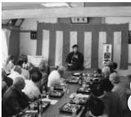
古戸地区敬老会 9月19日 愛知大学落語研究会