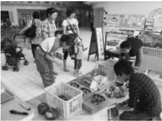
大学生が東栄産野菜を販売（豊橋市にて）

・ 具体的に・・・ 平成19年度より学生らが東園目地区の調査を行い、平成21年には東園目地区住民を対象に現地報告会を行いました。そして、まちづくり地区協議組織立ち上げのため、交流から始めるということで東園目地区住民と学生の交流会も実施しました。 また、学生の地域づくりサポートによる農産物の販売活動として、NPO法人ななさとぐるーぷと協力し、平成21年6月より毎週土曜日子ども未来館（豊橋市）にて東栄町の高齢農家の余剰野菜販売を行いました。