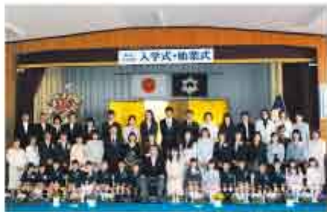
東栄小学校入学式