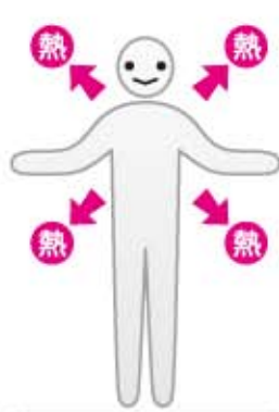
体温が一定に保たれている

ユースなどで耳にする機会も多くなり、危険な症状だという認識は持っているが、詳しいメカニズムを知っている人は少ないのではないだろうか？ 熱中症とは、高温多湿等が原因となつて起こる症状の総称です。 熱中症を引き起こすそもそもの根底には、人の体温を調節するメカニズムにあります。気温が体温よりも低ければ、皮膚に血液を多く流して皮膚の表面から空気中へ熱を放出し、体温の上昇を抑えることができます。また、湿度が低ければ、汗をかいてそれが蒸発することで熱が奪われる（気化熱）ので、体温を上手にコントロールすることができます。しかし、気温が体温より高くなると、空気中