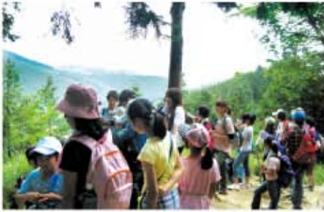
「本宮山にチャレンジ!」山歩き教室