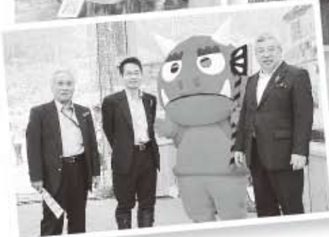
会場には愛知県永田副知事も来場。オニスター観光大使もがんばっています。