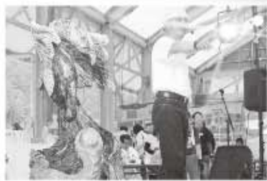
オークション風景。今大会は、入賞賞金とオークション売上金額の一部が義援金にあてられました。