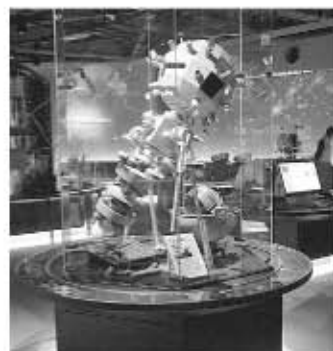
写真：名古屋市科学館5階の展示 ゾーンに置かれた御園のプラネ タリウム投影機。

ここで紹介（宣伝）されています。 名古屋市科学館に行く機会がありま したら、ぜひご覧になってください。 また、御園天文科学センターでプラ ネタリウム投影機とともに活躍してい た多くの望遠鏡は、今もスターフォー レスト御園で、訪れた人々に美しい星 の光を届けています。