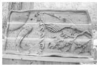
世界チャンピオンのブライアン・ルース氏が被災地域のためにつくった作品。被災地へ贈呈される予定です。