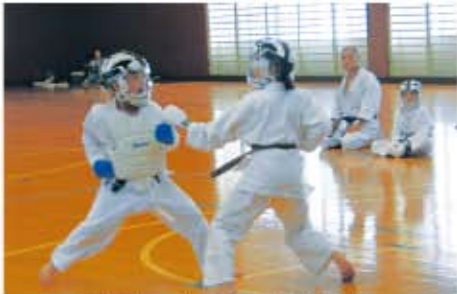
B&G体育館で空手合同稽古開催