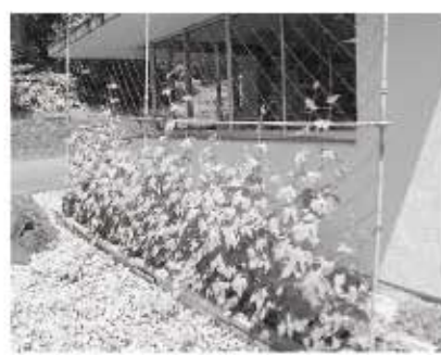
緑のカーテン成長中!(教育委員会)

5 買い替える省エネ冷蔵庫は、ここ10年で約50%もの省エネを達成している優秀な家電のひとつです。「年間消費電力量」を確認・比較してみてください。 以上のポイントをお試ください。