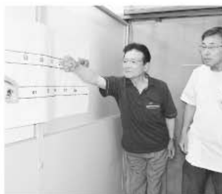
【前傾バランステストの実際の様子】

運動器検診のお申し込み、お問い合わせは役場福祉課 ☎七六一一八一五まで、お気軽にご連絡ください。