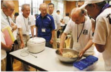
奥三河の名人集結 極奥三河・交流会