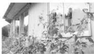
緑のカーテン育成中(分庁舎)

の乾燥、部屋の換気、隣室への空気の送り込みなどにも使えるので、1年中活用することができます。