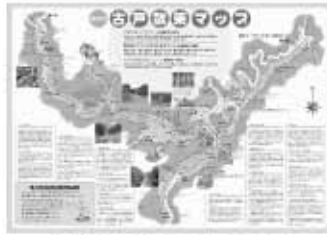
完成した「古戸散策マップ」地図

古戸ひじり会では平成23年度に古戸の魅力を、地区住民を含めて、多くの人に知ってもらい、日常的に古戸を楽しむことができるように、散策マップづくりをいたしました。マップづくりにあたっては地区住民をはじめ、古戸おいでん塾の塾生、さらには愛知大学の学生などが参加し、一緒になって古戸の魅力を掘り起こしながらマップの作成を行いました。