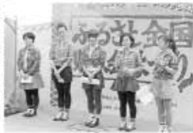
▲町外でのPRも積極的にしています！