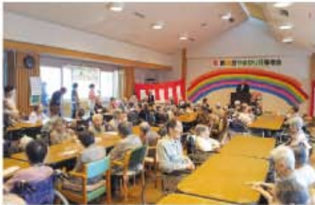
元気が一番！ 東栄町各地区 敬老会