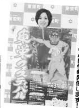
▲花祭を中心に情報発信します！