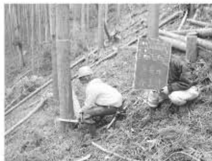
あいち森と緑づくり事業