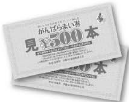
プレミアム商品券事業