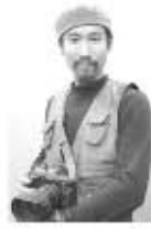
渡部 陽一氏 (戦場カメラマン/ジャーナリスト) 『いのち』を伝える