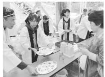
東栄フェスティバル