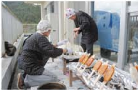
すぎのきの里で五平餅をふるまう