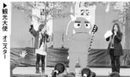
▶観光大使 オニスター