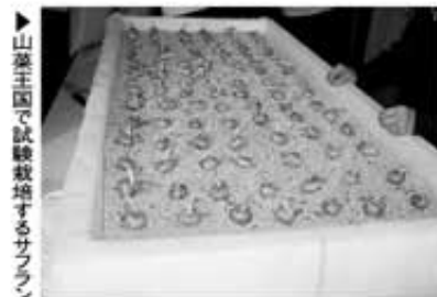
▶山菜王国で試験栽培するサフラン