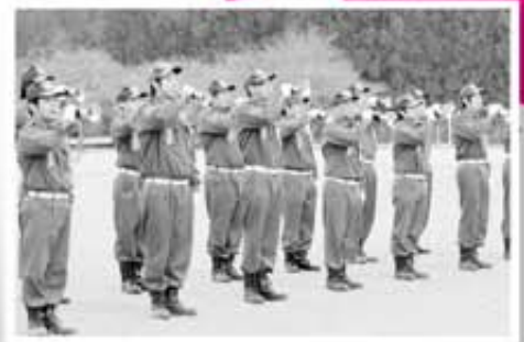
ラッパ隊の吹奏は迫力がありました。