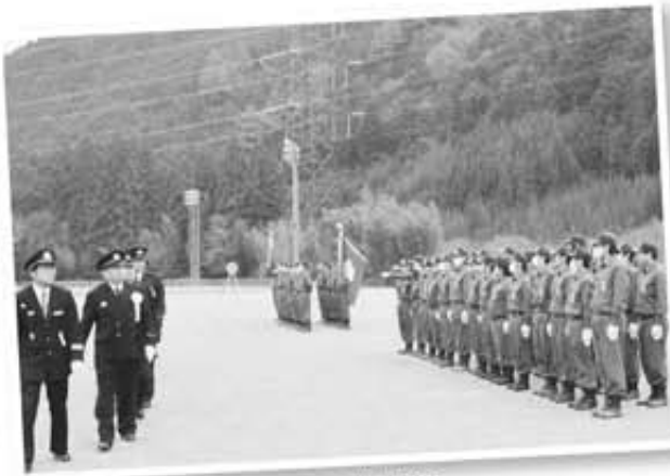
閲団を受ける消防団員