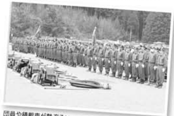
団員や積載車が勢ぞろい

3月10日旧総合グラウンドで、東栄町消防観閲式が行われました。104名の消防団員は閲団を受けるとともに、小隊訓練やポンプ操法など、日頃の訓練の成果を披露しました。また、功績のあった団員や長年勤務された退職団員などに賞状が送られました。