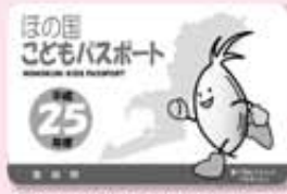
ほの国子どもパスポート(東栄町版の見本)

東三河広域協議会事務局 政策企画課内 ☎五三三一五一一二八〇 http://www.east-mikawa.jp/