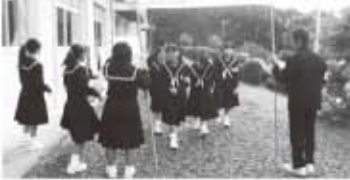
生徒会による朝の呼びかけ

生徒会が中心となりあいさつ運動を進めています。保健委員会では、あいさつに関する標語を募集し、入賞作品を選び、校内に掲示しています。 「あいさつで 活気あふれる 東栄町」 「立ち止まり 大きな声で あいさつを」 「おはようで 咲かせるあいさつ こんにちは ち輪」「つなげよう心と心 あいさつで」 「あいさつは 笑顔生まれる 合言葉」「目が合えば 素敵な あいさつ 私から」 月曜日の朝は、週ごとに、各委員会が分担して、登校してくる生徒たちに、「心をこめてあいさつしよう!」の横断幕を持ち、「二人一人がきちんとしたあいさつができる学校、そして明るく礼儀正しい学校」にしたいとの思いで、呼びかけています。