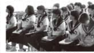
真剣に耳を傾ける生徒

6月26日(金) 近隣の公立と私立高校、計六校の先生をお招きして進路学習会を開催しました。保護者の希望者と二・三年生が、二会場で行われる説明のどちらか、合計三校を選択して話を聞きました。