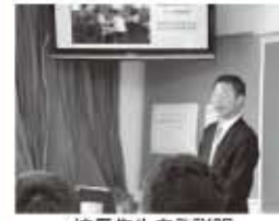
校長先生自ら説明

なお、昨年度から始まった、田口高校との中高一貫教育により、本年度から、東栄中学校でも田口高校を受験する場合は、連携型入試も選択肢の一つとなりました。