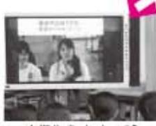
卒業生のメッセージ

どの高校も、プレゼンテーションやパンフレット、卒業生のビデオメッセージなどを用意し、熱心に分かりやすい説明をしてくださいました。