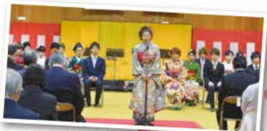
一人ずつ抱負を述べる新成人