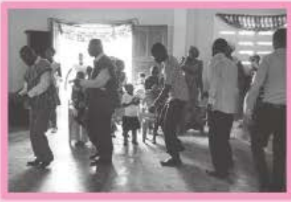
教会でダンスをする人たち