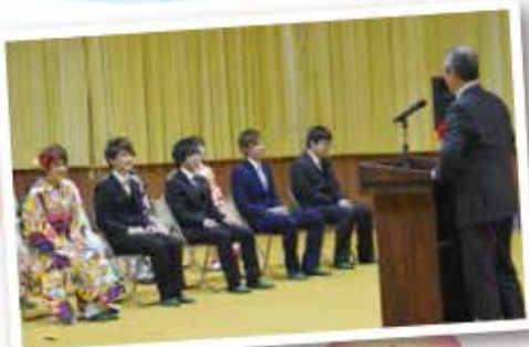
恩師が贈る祝福のメッセージ