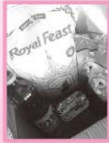
職場同僚から頂いたクリスマスギフト

ガーナの人々はとても信心深く、純粋に神を信じています。それでいて他の宗教にも寛容です。毎朝モスクからのコーランで目覚め、教会からの讃美歌に耳を澄ましつつ、精霊の話にも真剣に耳を傾ける。ガーナ人の平和的でおおらかな気質が現れていると思います。