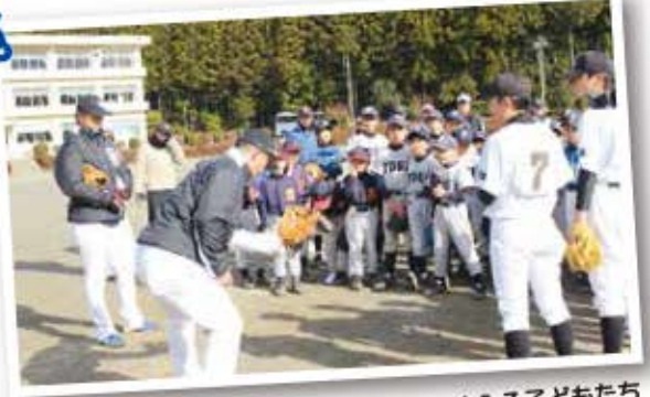
熱心な指導に聞き入る子どもたち