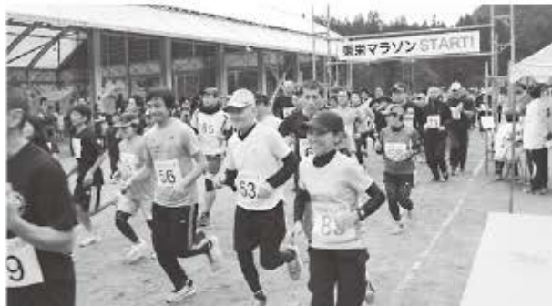
昨年度一般の部の様子

● 問い合わせ先 東栄町教育委員会 電話：0536-76-0509 Fax：0536-76-0513