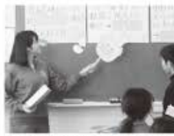
食の重要性を説明するグループ

2学期の最終週、保健委員会は各教室で「三三保健集会」を開催しました。保健委員は、衛生・食・睡眠グループに分かれて、それぞれ、風邪との関係性を詳しく説明してくれました。