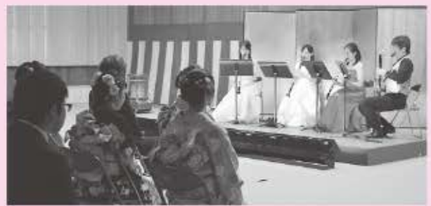
「アンサンブル・グラナディラ」による祝福の演奏

1月8日(日)、東栄中学校武道館で成人式が行われ、今年新成人となった23名のうち22名が参加しました。晴れ着姿に身を包んだ新成人は、旧友や恩師との再会を喜び合い、また、成人としての決意を新たにしました。式典後のアトラクションでは、新成人を祝うクラリネット四重奏「アンサンブル・グラナディラ」による生演奏が行われ、会場を盛り上げました。式の様子は4ページでも紹介しています。