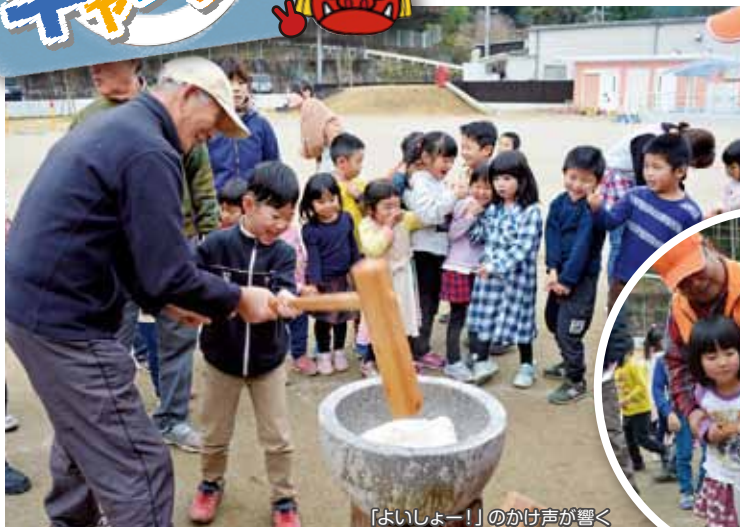
「よいしょー!」のかけ声が響く