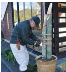
材料集めからすべて手作り

年末年始にかけて、東栄駅に門松が設置されました。これは、毎年、町民の方のご厚意で設置されるものです。手作りで温かみのある門松が、帰省客などをお正月ムードでお出迎えました。