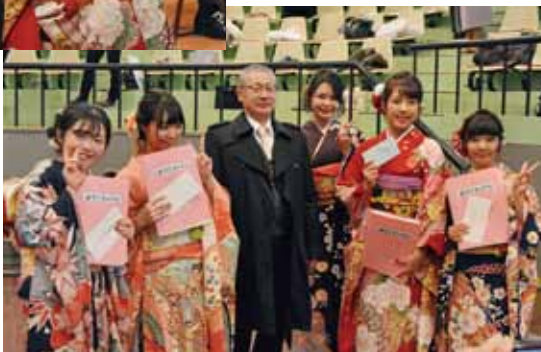
懐かしい思い出の品とともに