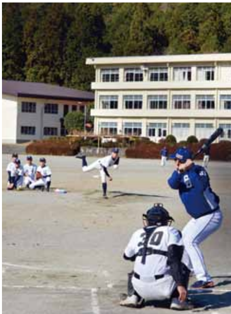
子どもたちと選手とのバッティング対決