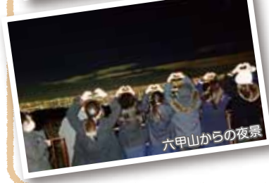
六甲山からの夜景