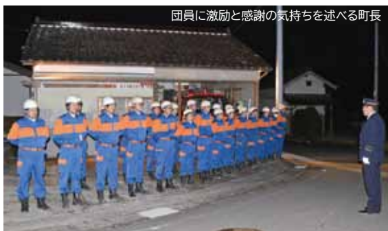
団員に激励と感謝の気持ち进行町長

東栄町消防団による年末警戒が12月27日(金)から29日(日)にかけて実施されました。 町民の皆さんが安心して年末を過ごせるよう、各分団は「火の用心」と呼びかけながら、受持区域内を巡回し、火災の未然防止に努めました。初日には、町長や団長らが各分団の実施状況を巡視し、団員を激励しました。