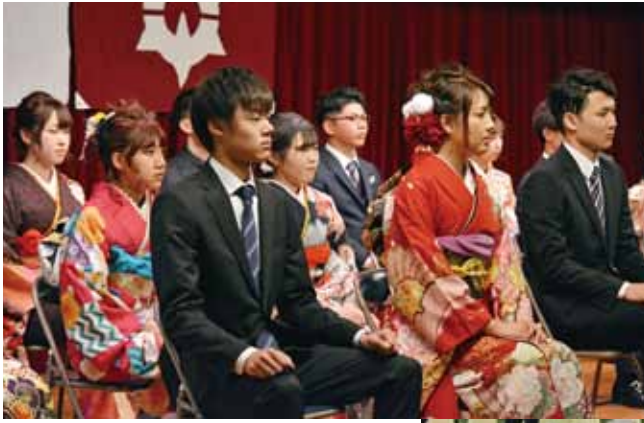
町長や恩師からのメッセージに耳を傾ける