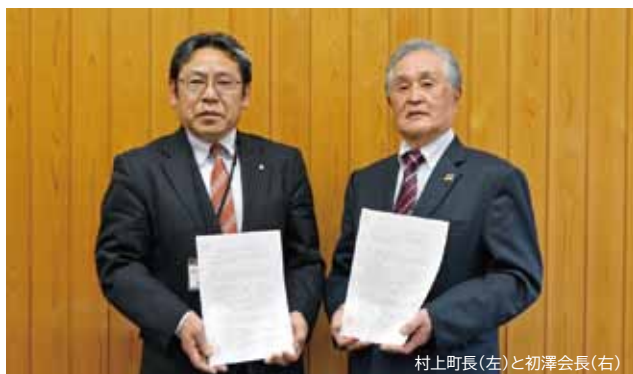
村上町長(左)と初澤会長(右)

バスで地元食材のコース料理を味わいながら、産地を巡る「東三河レストランバス」の東栄・豊根コースが、3月26日(木)～29日(日)までの4日間、運行されました。合計85名が参加。町内では、志多らの演奏や手作りコスメ体験「naori」などを楽しんでいただきました。