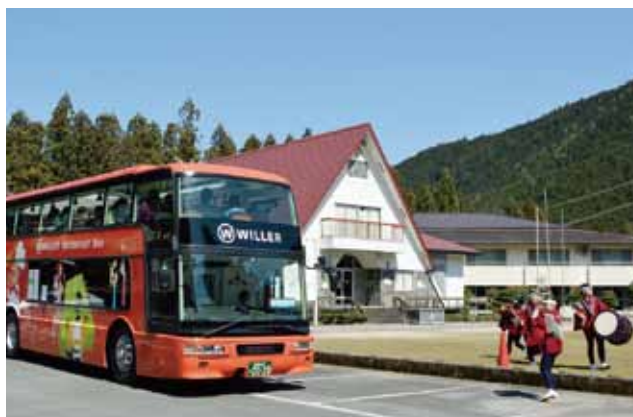
志多らのメンバーがお見送り