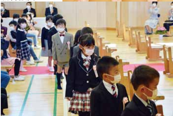
東栄小学校入学式