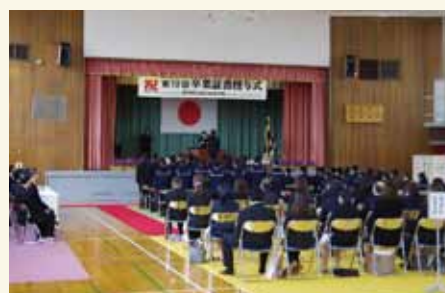
卒業証書が授与されました