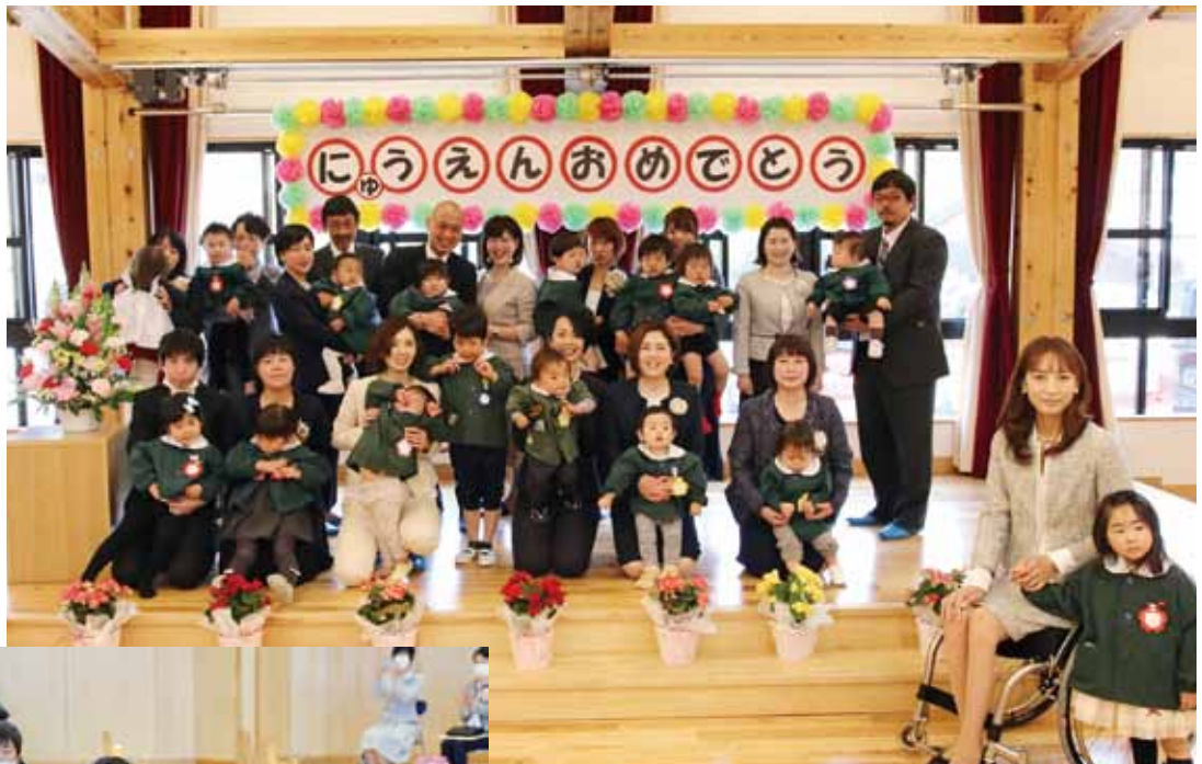
とうえい保育園入園式