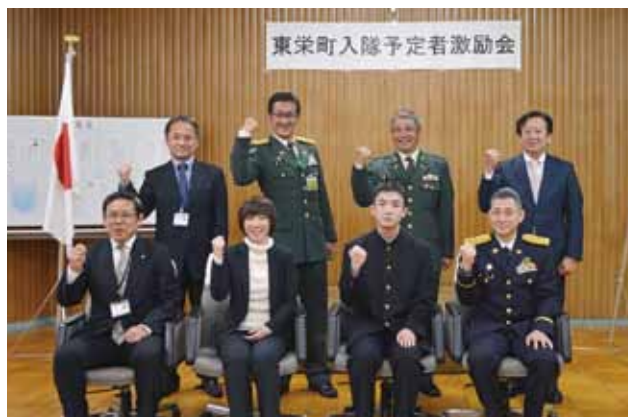
東栄町入隊予定者激励会

町の地域防災計画には「災害ボランティアセンター」の設置、運営を定めており、その実効性を高めるため、取り決めやそれぞれの役割を明確化したものです。町長は、「今後、当町が被災した際、円滑に災害ボランティアセンターを設置・運営できるよう、連携して取り組んでいきたい。」と話しました。