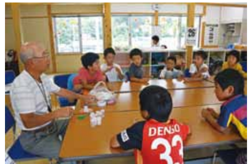
放課後児童クラブ