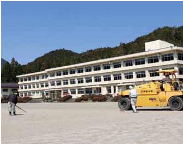
ローラーで転圧して整地