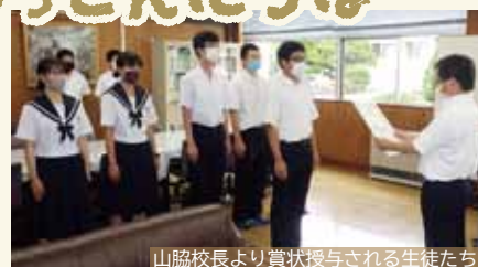
山脇校長より賞状授与される生徒たち