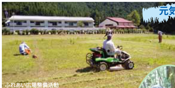
ふれあい広場整備活動

皆さんの使っているチェーンソーオイルは、植物性ですか？鉱物性ですか？植物性のチェーンソーオイルは生分解性で、環境にやさしいオイルです。植物性オイルを含んだおが粉は、堆肥になるので、畑などに利用することができます。チェーンソーアートクラブでは、クラブ設立当初から環境のことを考え、植物性のチェーンソーオイルを使用しています。そしてそのオイルの原料となる使用済み天ぷら油を回収してチェーンソーオイルにリサイクルする活動を、昨年5月のチェーンソーアート大会でも行いました。今年度は、その活動を町内でも推進するため、使用済み天ぷら油の回収活動を行うことにしました。皆さん、ぜひご協力をお願いします。●問合せ・チェーンソーアートクラブ東栄 ☎76・1199