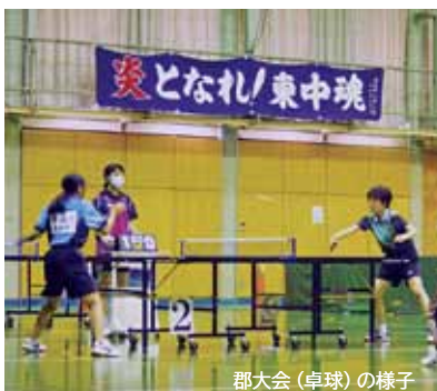
郡大会（卓球）の様子

た力をさらに高めようと一生懸命でした。これまで目標にしてきた、県、東三河の大会は中止になりましたが、「力を出し切り、やり切った」という区切りの場を」という生徒、保護者、地域の方、先生、支えてくださるすべての方々の熱い思いから郡大会が実現しました。