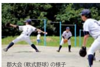
郡大会（軟式野球）の様子

今年度は、新型コロナウイルス感染症拡大防止のための臨時休業があり、学習はもちろん、部活動も十分できない日が続きました。各種大会はすべて中止となり、例年であれば、練習試合等を重ねて技術を磨いていく時期も自宅での自主トレ。学校が再開されてからも、対外試合はできず、校内練習で技術を高めていくしかありませんでした。