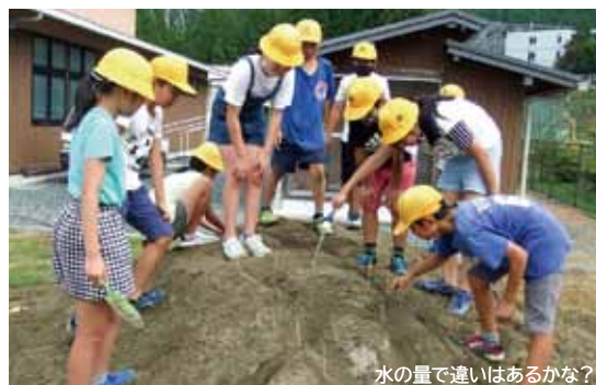
水の量で違いはあるかな？