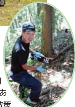
城山散策コースの看板整備

中設楽地区を元気で住みよい地域にするということを目的に、地区の美化活動などの地域づくり活動を行っている「元気城山」。