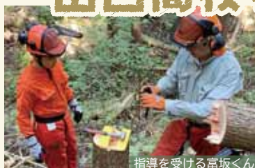
指導を受ける富坂くん