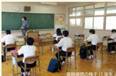
進路補習の様子（1年生）