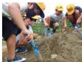
流れが速いとうなるかな？