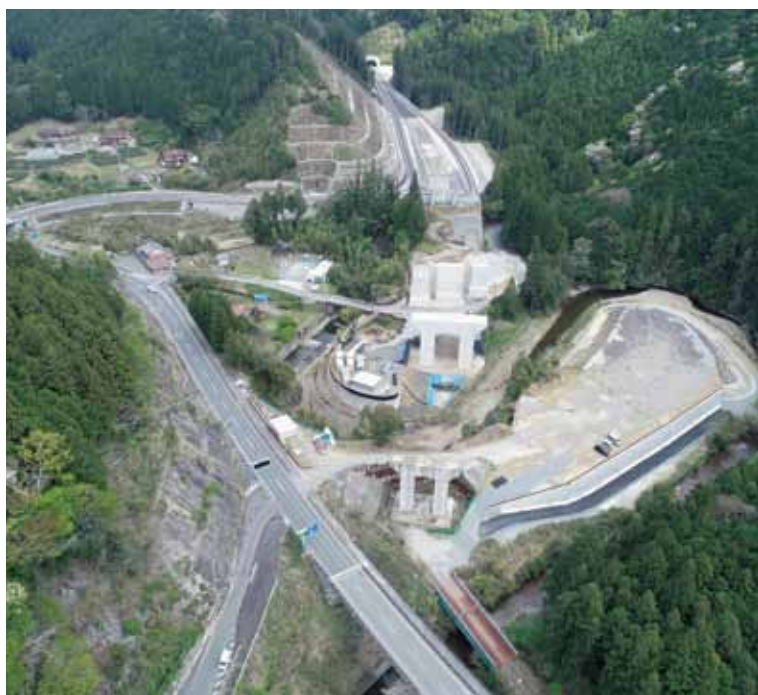
新城市側から東栄 IC を望む