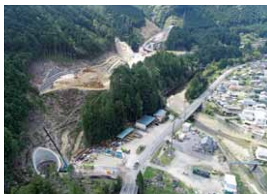
東栄町側から鳳来峡 IC を望む