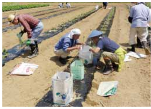
ゆたかわファーム東栄 ・加賀野地内