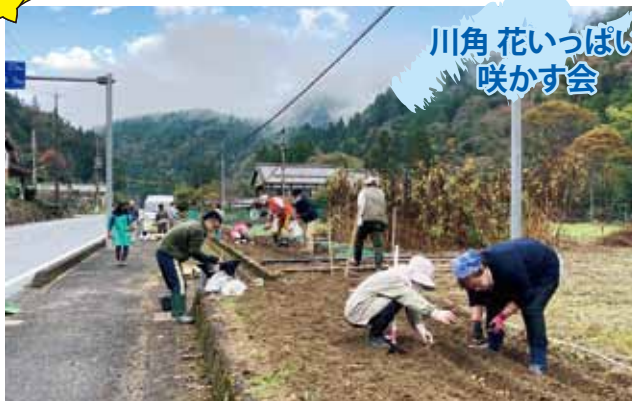
川角 花いっぱい 咲かす会

60代は第2の人生のスタートとか。その人生と地域を、熟年パワーを若い力にも支えてもらい花いっぱいにするための活動を開始しました。様々な地域愛あふれる案が出ましたが、今年はお宮の裏にドウダンツツジとミヤマツツジの植栽、そして川角のメインストリートに水仙の球根を植えました！