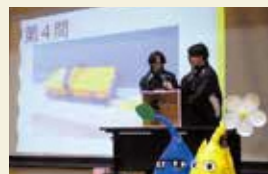
クイズ「箱の中身は何だろな？」を楽しむ3年生