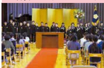
6年間ありがとうございました！