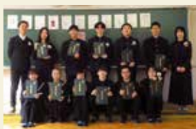
普通科3年生 教室にて