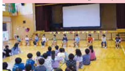
インタビューでとてももしっかり答えた1年生

児童会執行部が中心となり、全校で1年生を迎える会を行いました。1年生へのインタビュー、東栄小での過ごし方に関する〇×クイズ、もうじゅうがりゲーム、最後に2年生からのプレゼントを渡して会を閉じました。全校みんなで楽しんで仲を深めることができました。また、高学年にとっても企画力を高めるよい機会となりました。