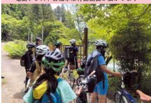
電動アシスト自転車は行動範囲が広がります

う1グループは、ぼたびで電動アシスト自転車を借り、月地区まで行きました。2日目は、コースを入れ替えて実施しました。