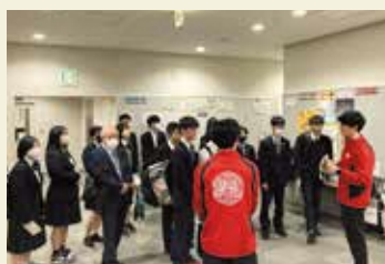
進学コース (名城大学にて)

4月18日(木)に3年生全員が、進路選択の参考とするために、進学希望者は大学へ、就職希望者は地元企業へ行き、見学しました。今後の進路希望実現に向けて、有意義な経験ができました。