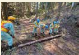
林道を整備する生徒たち

4月26日(金)に林業科2年生が演習林実習を実施しました。今年度は施設の工事が予定されているため、日帰り日程で実施しました。実習では、主に林道整備を行い、大雨で林道が削れないようにゴム製の板を設置しました。硬い土を一生懸命掘る姿も見られました。