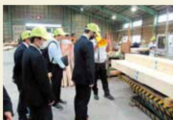
就職コース (大森木材にて)